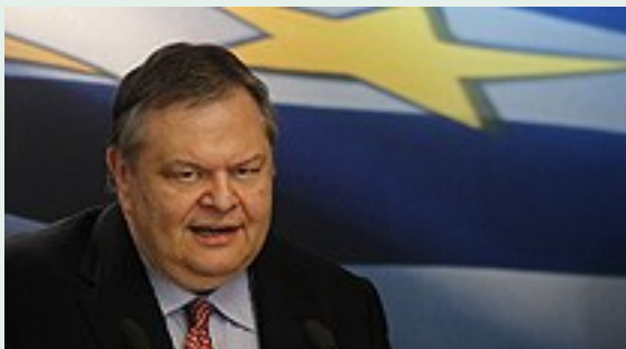
Greklands nu hårt pressade finansminister Evangelos Venizelos

Ekonomiskt riskerar också Tishrei att drabbas av turbulens. Inom flera emu-länder ökar nu risken för att man på grund av stigande lånekostnader inte fullt ut kan trygga en finansiering. Vissa europeiska banker har också visat tydliga tendenser till att ha svårigheter att finansiera sig vilket pekar på ett ytterst allvarligt läge. Samtidigt ger flera euroländer prov på nonchalans genom att inte följa sitt eget regelverk. Grekland spelar ett högt spel då man inte lever upp till de åtaganden man tillsammans med den internationella långivartrojkan (EU-kommissionen, ECB och IMF) kommit överens om. Aktuella siffror visar att landets ekonomi är på väg att krympa mer än beräknat och väntas sluta på mer än 5 procent minus under innevarande år. Den grekiska