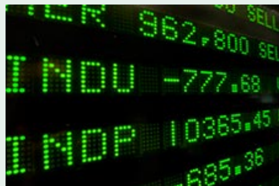
29 september 2008, New York-börsen faller 777,7 punkter eller 7 procent. Detta är en profetisk händelse då det sker samma timmar som det Judiska Nyåret inleddes med Basunhögtiden.

Historiskt vet vi att hösten och framför allt tiden runt månaden Tishrei och Hösthögtiderna har varit turbulent för världens aktiebörser med ibland kraftiga kursras. Sju av Wall Streets tio största kursfall har inträffat under månaderna september och oktober. En av dessa sju är kursrasen 29 september 2008 vilket får betecknas som en profetisk händelse då det inträffade under samma