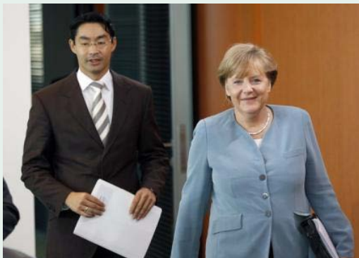
Förbundskansler Angela Merkel, här tillsammans med partiledaren för koalitionspartiet (FDP) Philipp Rösler

Italiens finansminister Giulio Tremonti och centralbankschefen Mario Draghi dagen före den italienska senatens beslut att acceptera sparpaketet på 54,2 miljarder euro.